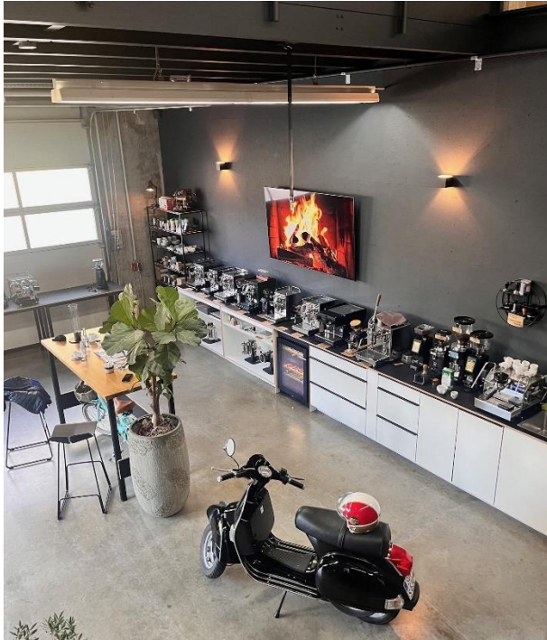
Der stilvolle Showroom in Herxheim vereint Italo-Flair und Technikpräsentation.